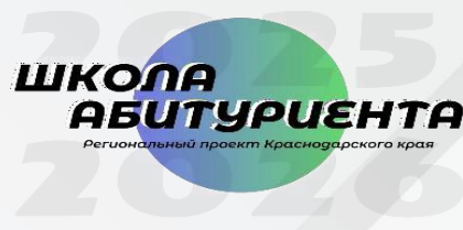
график семинаров на 2-е полугодие